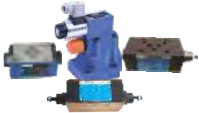
Válvulas Modulares y Montaje en Placa Válvulas Check Pilotadas / Válvula control de flujo Válvulas control de presión