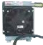
Intercambiador de Aire