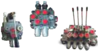
MCD 20 / 50 VÁLVULAS MONOBLOCK DE 1 / 2 / 3 / 4 / 5 / 6 MANDOS