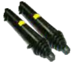
Pistones Hidráulicos Telescópicos