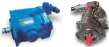
PVB5 / 6 / 10 / 15 / 20 / 29 / 45