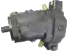
Motor Hidraulico de Pistones