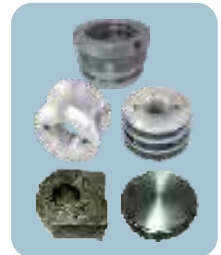
Tapa, embolo orejas.