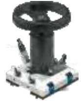
Timón, Válvulas de presión y Accesorios.