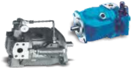
A10V0 / 18 / 28 / 45 / 71 / 100 / 140