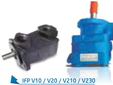
IFP V10 / V20 / V210 / V230