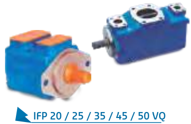
IFP 20 / 25 / 35 / 45 / 50 VQ