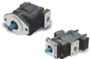
P3150 / P3300 / P3500 / P3650