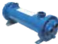
Intercambiador de Agua