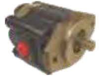
Motor Hidraulico de Engranaje