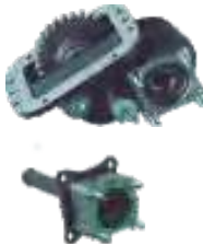
Tomas de Fuerza