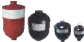
Acumulador de Diafragma