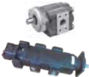
P3100 / P5100 / P7600