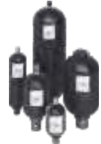
Acumulador de Blader