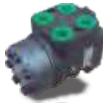
Orbitrol Centro Tanden, Cerrado, Ls