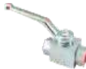
Válvulas de 2 vías