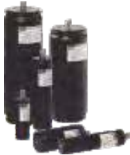
Acumulador de Pistón