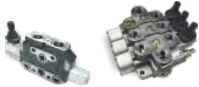
MCD 25 / 100 VÁLVULAS SANDWICH DE 1 A 12 MANDOS Hasta 100 GPM