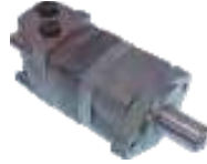
Motor Hidraulico de Gerol